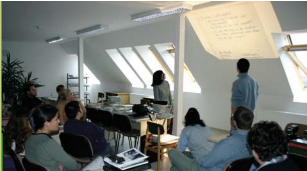
Bild links: Schulpraktikum „Deutsch als Fachsprache“ für Lehramtsstudenten im September 2004 in Pécs mit Unterstützung der Zentralstelle für das Auslandsschulwesen

Die deutsche Regierung hat als Reaktion auf die gestiegene Nachfrage an ungarischen Schulen zum Erlernen des Deutschen sowohl als Fremd- als auch als Muttersprache zusammen mit den Bundesländern ein Lehrerentsendeprogramm entwickelt. Für das Schuljahr 2004/2005 sind 45 Gastlehrerinnen und -lehrer an ungarischen Lehrinstituten – hauptsächlich im Deutsch-, aber auch im Fachunterricht – tätig.