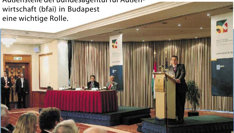
Bild rechts: Bundeskanzler Schröder bei einer Veranstaltung der DUIHK in Budapest im September 2004